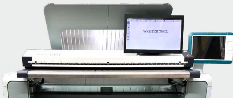
Сканер, установленный на принтер Canon