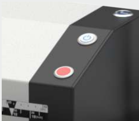
Сохранение результатов сканирования на USB-носитель

На сегодняшний день WideTEK36CL-600-MF6 является самым быстрым цветным CIS-сканером на рынке. Устройство работает со скоростью 25 см в секунду и разрешением 200 точек на дюйм в полноцветном режиме. А сканирование с полной шириной захвата 36 дюймов и разрешением 600 точек на дюйм выполняется со скоростью 4,3 см в секунду. Более того, скорость сканирования увеличивается втрое при работе в черно-белом или полутоновом режимах, однако при необходимости (например, при сканировании особо ценных и хрупких оригиналов) ее можно снизить.